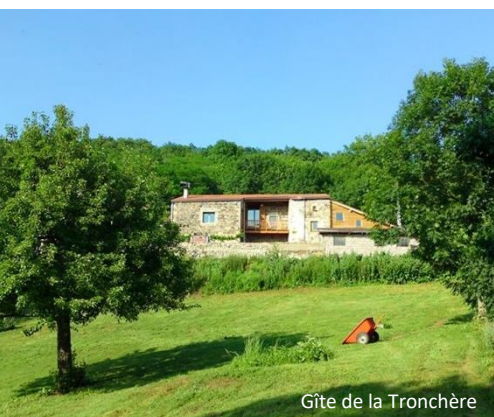
Gîte de la Tronchère