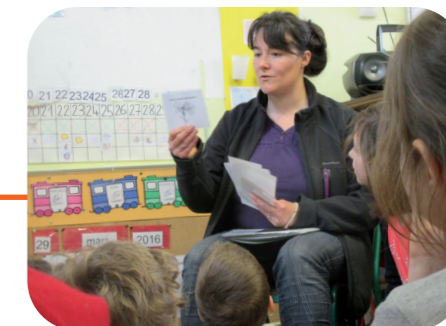
Ateliers de sensibilisation avec une animatrice environnement