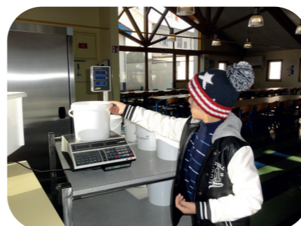
Pesée des déchets de cuisine à l'école d'Ambert