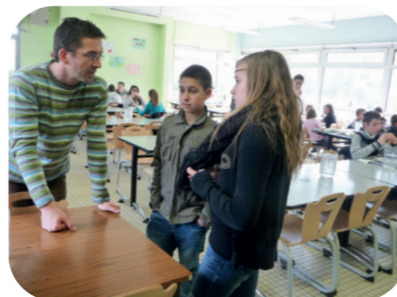
Intervention au collège de Rochefort Montagne - Gaspillage alimentaire

Les syndicats adhérents au VALTOM interviennent en amont des projets sur le tri et en aval pour pérenniser les projets.