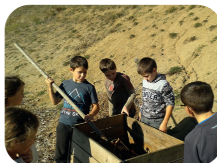
Les élèves de l'école d'Aydat brassant leur compost