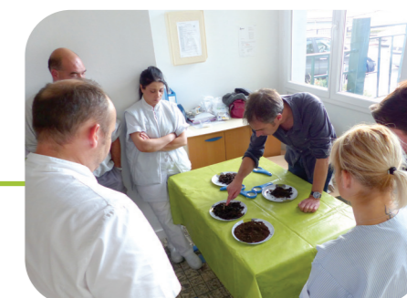
Formation du personnel de cuisine par un maître composteur à l'école d'Aulnat