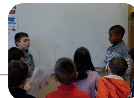
Les CM2 de l'école de Vertolaye, forment les plus petits à l'utilisation du composteur scolaire