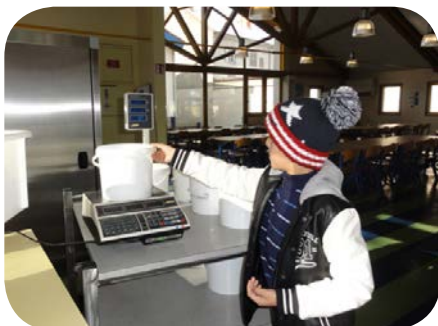
Pesée des déchets de cuisine à l'école d'Ambert