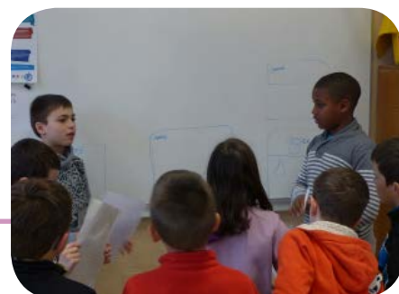
Les CM2 de l'école de Vertolaye, forment les plus petits à l'utilisation du composteur scolaire