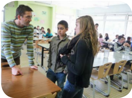
Intervention au collège de Rochefort Montagne - Gaspillage alimentaire