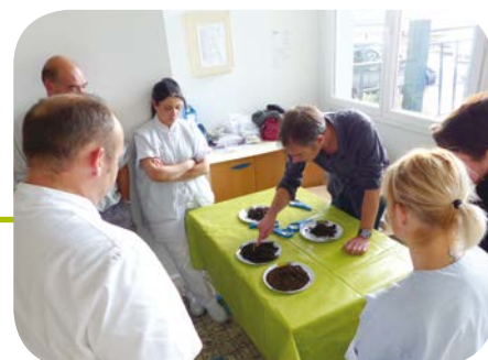
Formation du personnel de cuisine par un maître composteur à l'école d'Aulnat