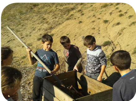
Les élèves de l'école d'Aydat brassant leur compost