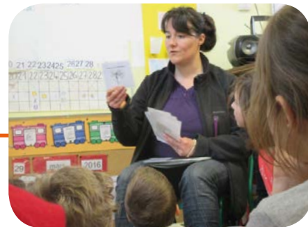
Ateliers de sensibilisation avec une animatrice environnement