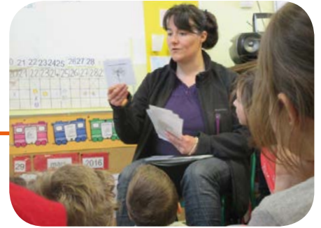
Ateliers de sensibilisation avec une animatrice environnement