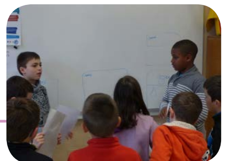
Les CM2 de l'école de Vertolaye, forment les plus petits à l'utilisation du composteur scolaire