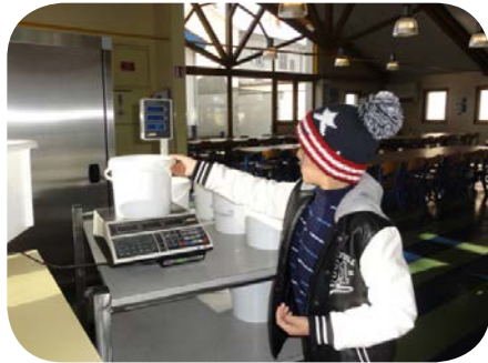
Pesée des déchets de cuisine à l'école d'Ambert