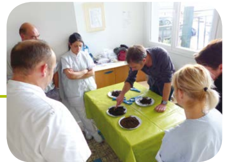
Formation du personnel de cuisine par un maître composteur à l'école d'Aulnat