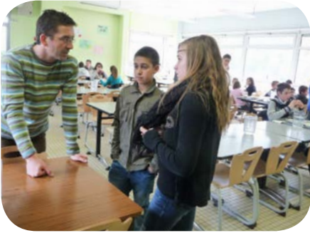
Intervention au collège de Rochefort Montagne - Gaspillage alimentaire