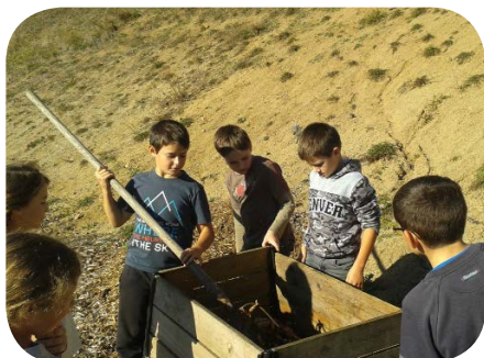
Les élèves de l'école d'Aydat brassant leur compost